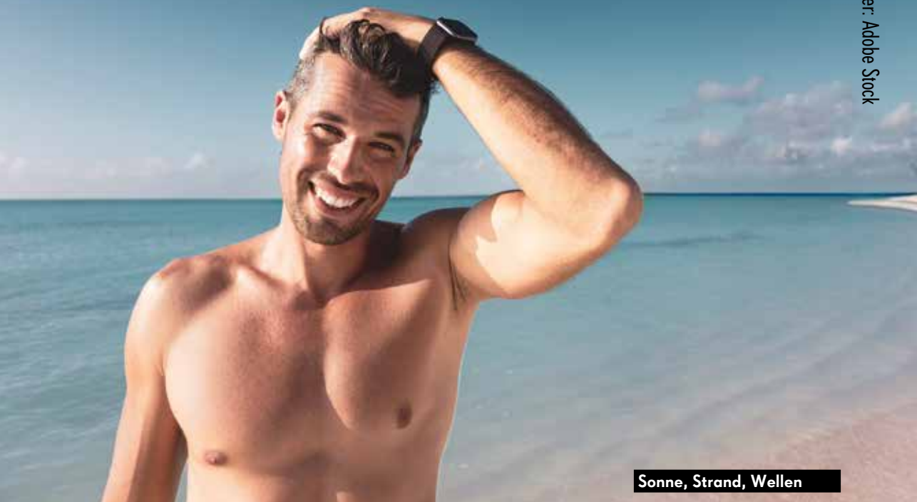
Sonne, Strand, Wellen

chen Charterflügen erfolgen. Zielflughäfen sind hier Varna und Burgas. Außerhalb der Ferienzeiten kann man bei WIZZ - Air fündig werden. Die Airline bedient die Strecke nach Varna nonstop mehrmals die Woche - auch in der kühleren Jahreszeit. Ansonsten fliegt man mit Bulgaria Air - der nationalen Airline - mit einem Zwischenstopp in der Hauptstadt Sofia, weiter in ca. 40 Minuten Flug zum Schwarzen Meer. Sollte man sich schon im Inland aufhalten, empfehle ich die günstige Anreise mit Zug oder dem Bus.