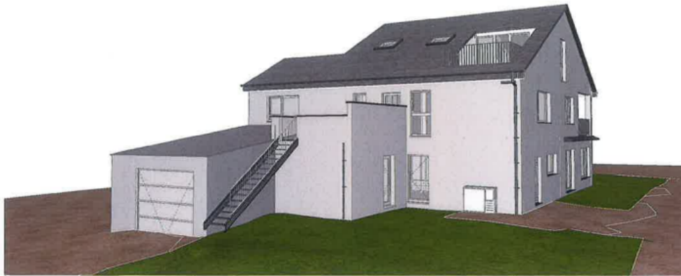
Façade arrière de l'habitation