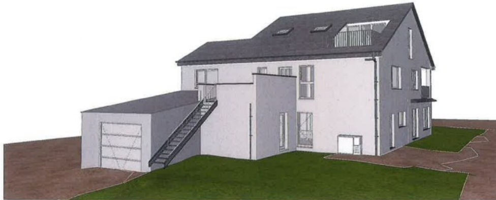
Façade arrière de l'habitation