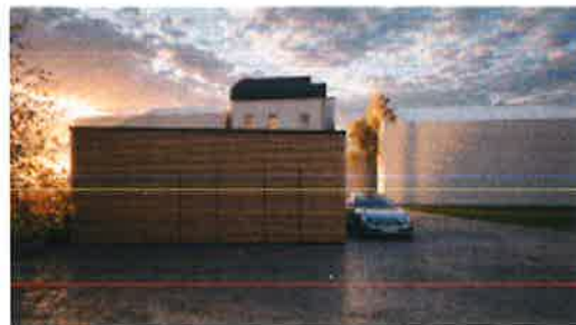
Local poubelles et vélos