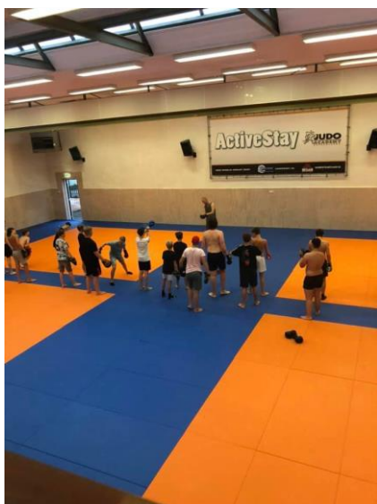
Avondactiviteit en avondeten uitsluitend bij overnachting.