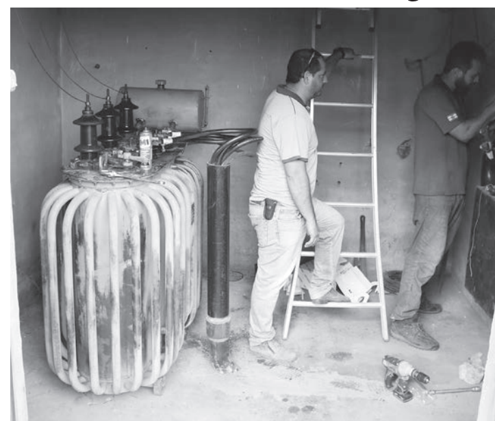
Manutenção aconteceu na última semana

Na última semana, a Prefeitura de Rafard, por meio do Departamento de Obras e Serviços, realizou o serviço preventivo de limpeza e troca do transformador, responsável pela Bomba de Recalque 1. O intuito, segundo o governo municipal, é evitar um possível curto-circuito e, por consequência, melhorar o serviço de abastecimento de água na cidade.