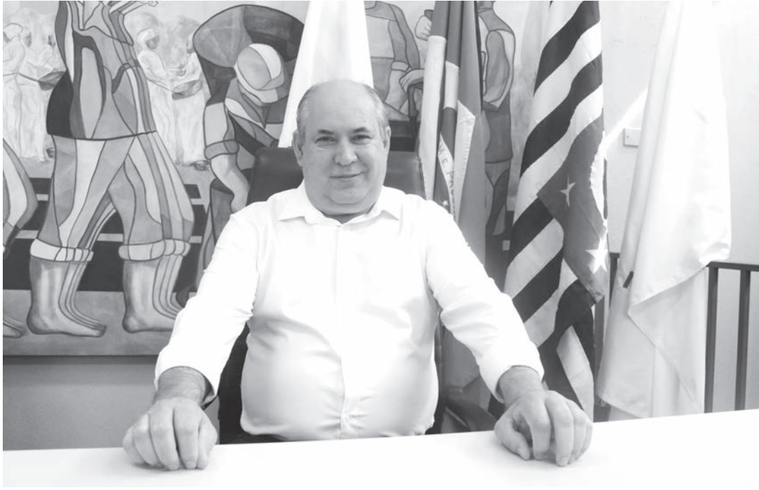
Prefeito de Rafard, Carlos Roberto Bueno, anunciou reajuste em vídeo divulgado nas redes sociais

Desde a última segunda-feira (10), está disponível na conta dos servidores públicos de Rafard o novo valor do Auxílio-Alimentação. O anúncio oficial foi feito pelo prefeito, Carlos Roberto Bueno, que confirmou através de um vídeo no Facebook o considerável aumento, passando o benefício de R$ 323 para R$ 500