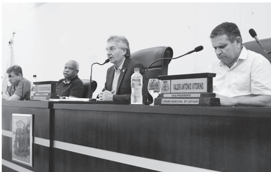
Assunto foi discutido na última segunda-feira (10), durante a sessão ordinária

Esta não é a primeira vez que estabelecimentos comerciais perdem