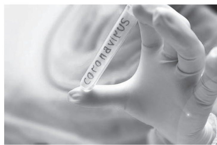
Caso em Porto Feliz é de uma criança que esteve na China (Foto ilustrativa)

Para consultar essas informações, é só acessar o link http://plataforma.saude.gov.br/