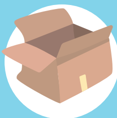
Una caja de cartón .