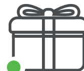
Bonificación por permanencia