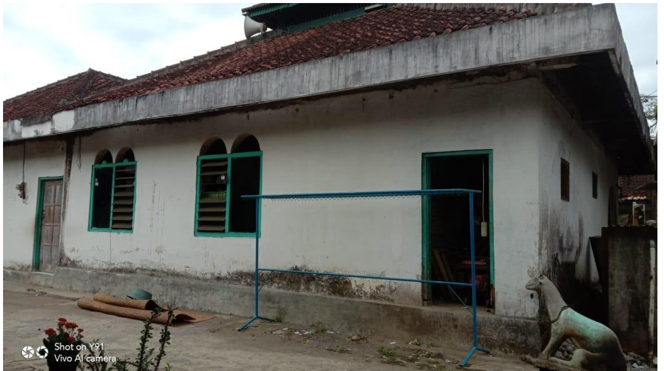
Foto Kondisi Masjid Sekarang