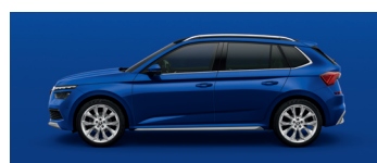
ENERGY BLUE UNI