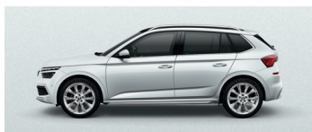
MOON WHITE METALLIC