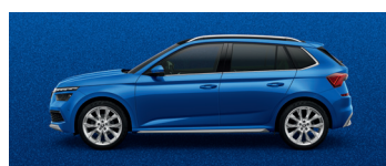
RACE BLUE METALLIC