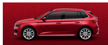
VELVET RED METALLIC