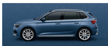
TITAN BLUE METALLIC