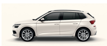
CANDY WHITE UNI