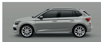
STEEL GREY UNI