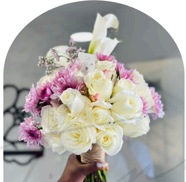
Éclat de Romance 100.000 F CFA

L'aspect vaporeux et aérien rappelle un petit nuage. C'est le choix idéal pour une mariée qui recherche de la douceur et un côté "féérique".