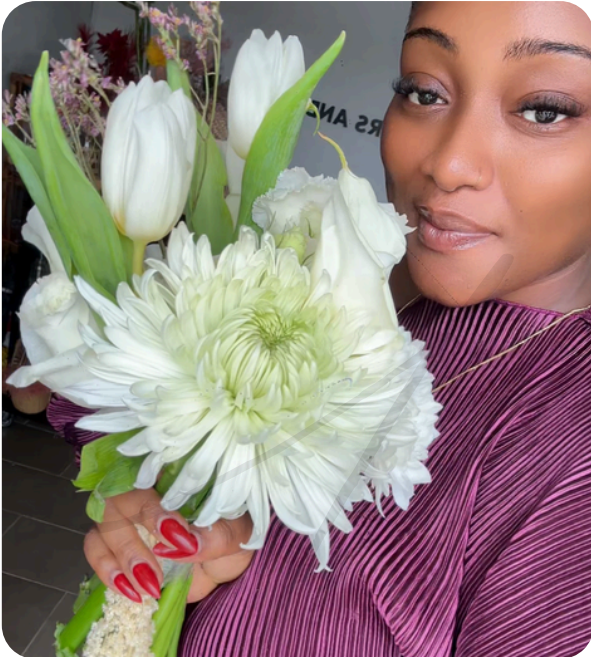
Aura de Nacre 120.000 F CFA

compositions florales nuptiales 100% naturelles