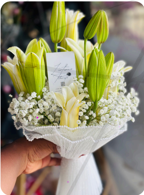
Lys en Majesté 120.000 F CFA

La touche de couleur apporte du dynamisme et de la passion, tandis que l'arum ajoute une silhouette gracieuse. Le lien en cordelette lui donne un côté "bohème chic".