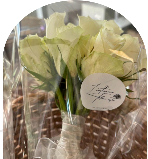
Finesse 60.000 F CFA

Ce bouquet allie la noblesse des variétés classiques à une structure moderne et aérienne. L'amarante retombante apporte une touche de mystère, tandis que le cœur de la composition dégage une clarté absolue. Une pièce maîtresse qui allie caractère et distinction.