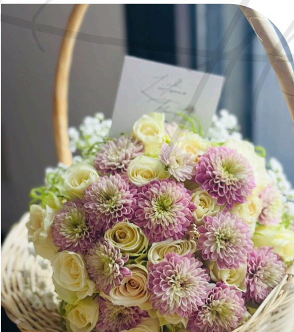
Jardin de Porcelaine 85.000 F CFA

Ce bouquet se compose exclusivement de roses d'un blanc virginal, sélectionnées pour la perfection de leur galbe et la tendresse de leurs pétales. Sculptée avec précision et liée d'un ruban vapoureux, cette création monochrome incarne une élégance minimaliste et un chic absolu.