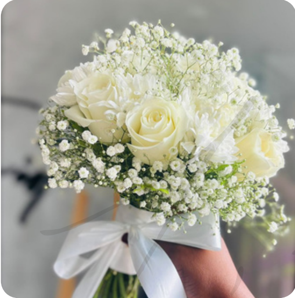
Rêve de coton 85.000 F CFA

compositions florales nuptiales 100% naturelles