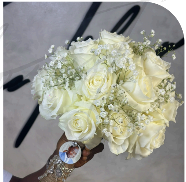
L'Ange Gardien 75.000- 100.000 F CFA

Le port altier des tiges vertes et la pureté du blanc en font un choix très statutaire et élégant, parfait pour une mariée à la recherche d'une allure royale.